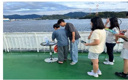
スタンプラリーの様子