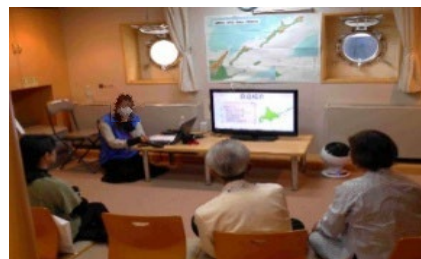
北方領土元島民後継者による語り部