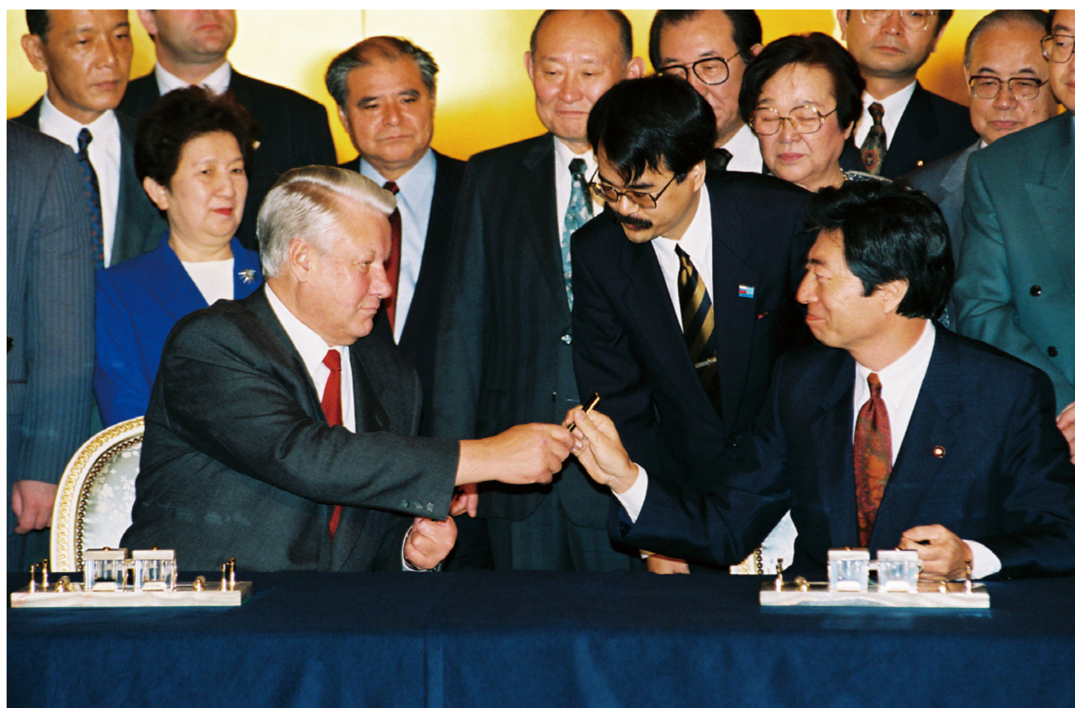
東京宣言に署名