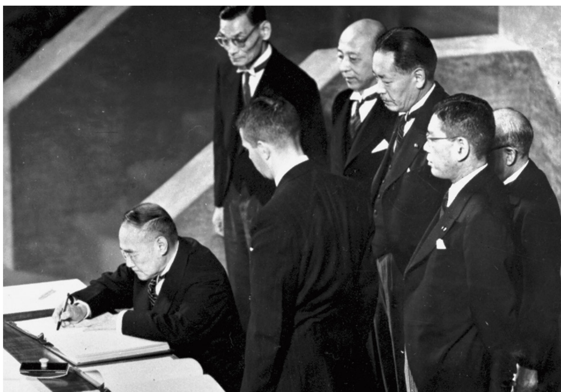
サンフランシスコ平和条約に署名