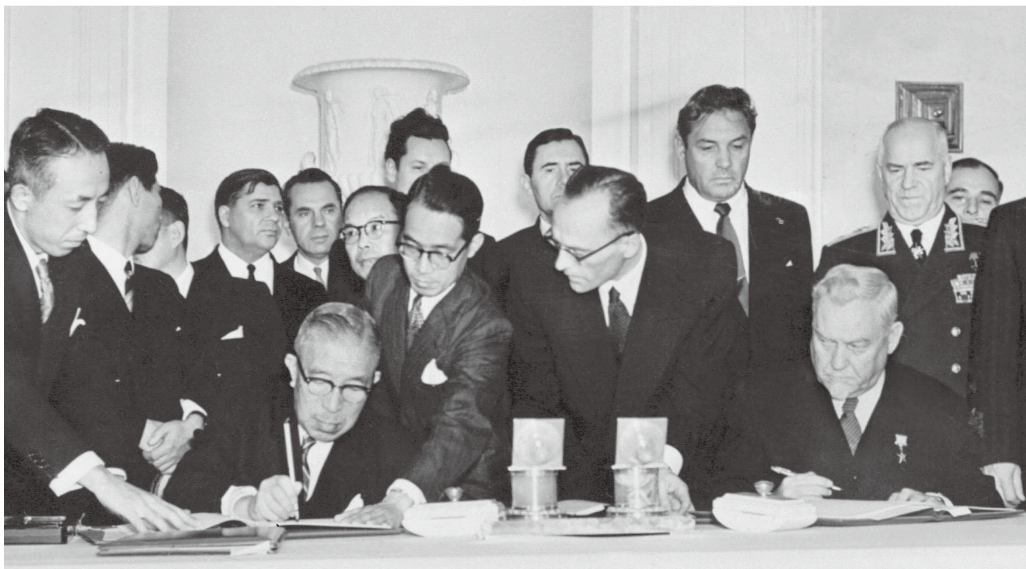
日ソ共同宣言に署名

この日ソ共同宣言において、ソ連は はぼ まい ぐん とう 歯舞群島及び しこ たん とう 色丹島を日本に引き渡すことに同意しましたが、 くな しり とう 国後島、 え とろふ とう 択捉島の日本への返還が未解決であったため、平和条約は結ばれていません。