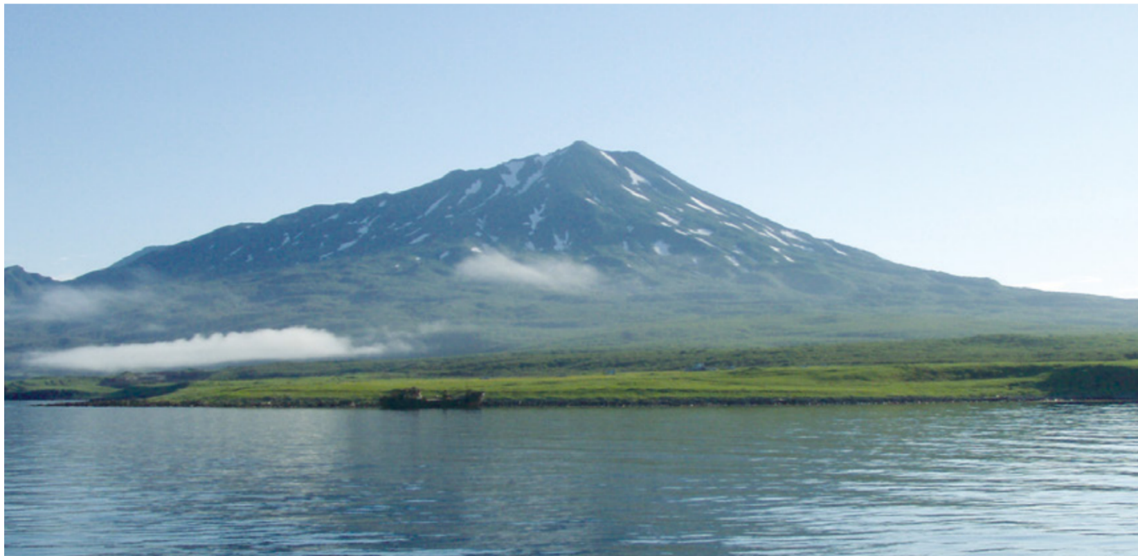
ちりつぷさん えとろふとう 散布山(択捉島)