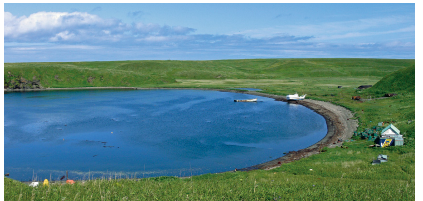
ぜいこまえ はばまいぐんとう ゆりとう 税庫前(歯舞群島・勇留島)