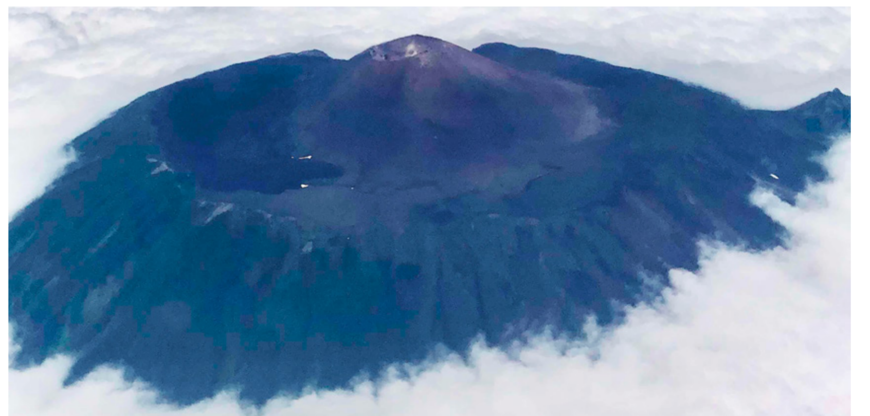
ちゃちゃだけ くなしりとう 爺々岳(国後島)