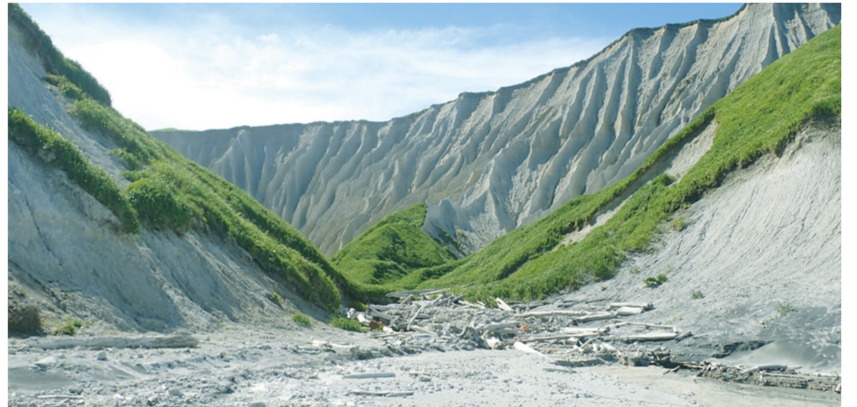
えとろふとう ピラ海岸(択捉島)