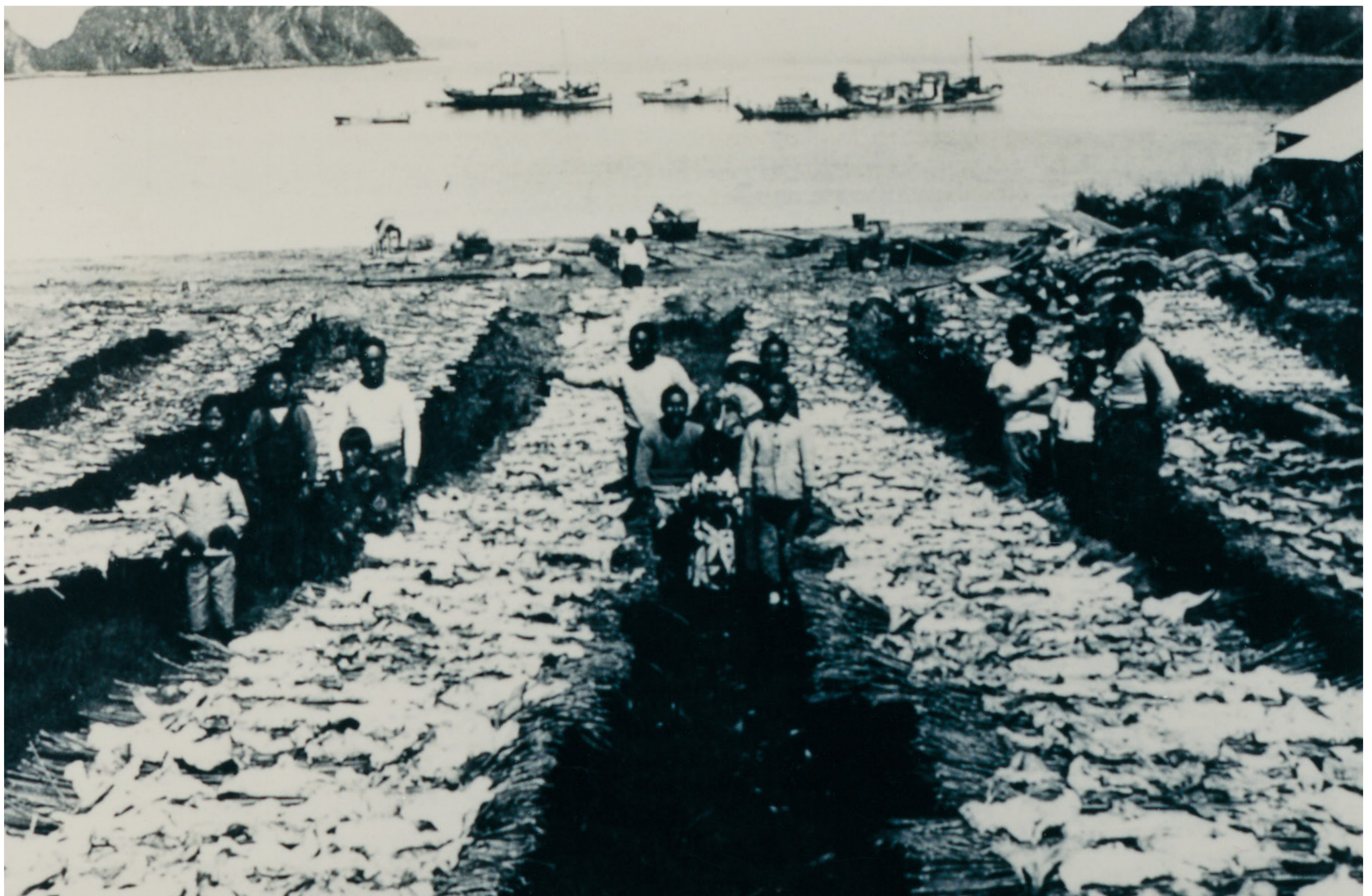
しこたんとう 色丹島でのタラの乾燥風景

北方領土の周辺の海は水産資源が豊富です。さけ・ます・たら・かれい・花咲がに・たらばがに・ほたて貝・こんぶ・のりなどが獲れ、戦前は漁業や水産加工業が産業の中心になっていました。