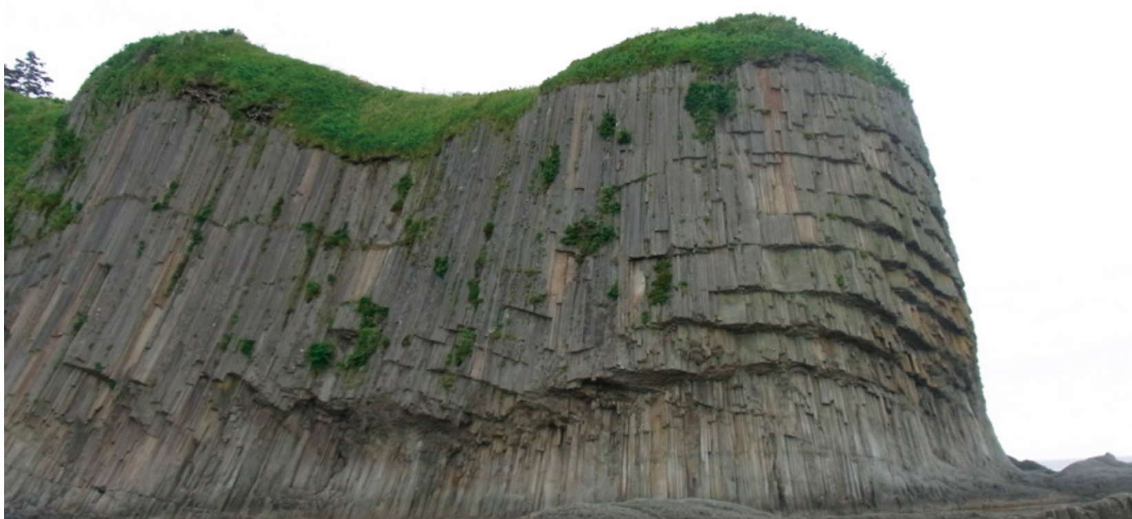
ざいもくいわ くなしりとう 材木岩(国後島)