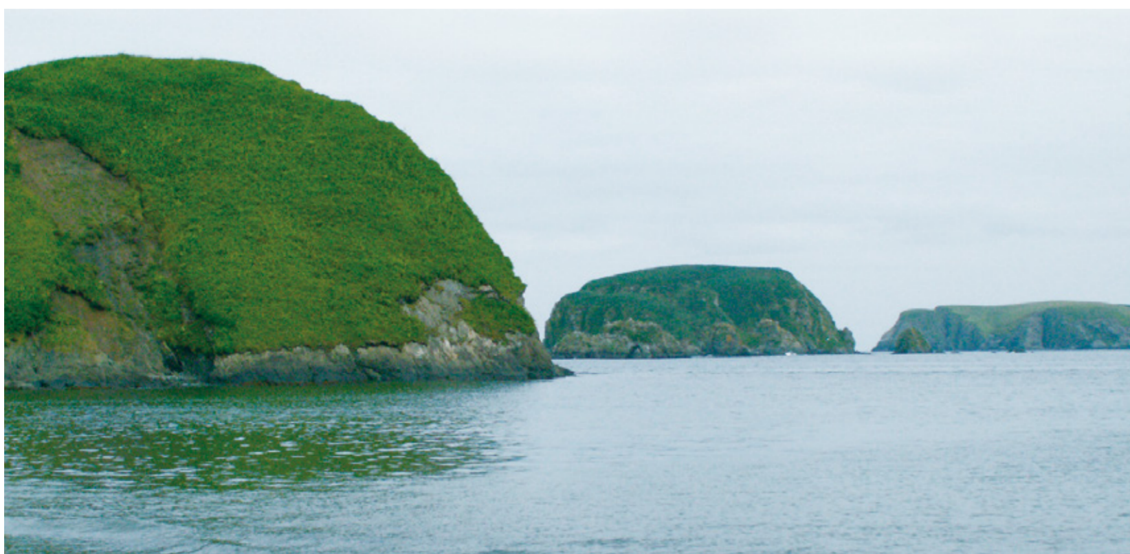
しこたんとう イネモシリ(色丹島)